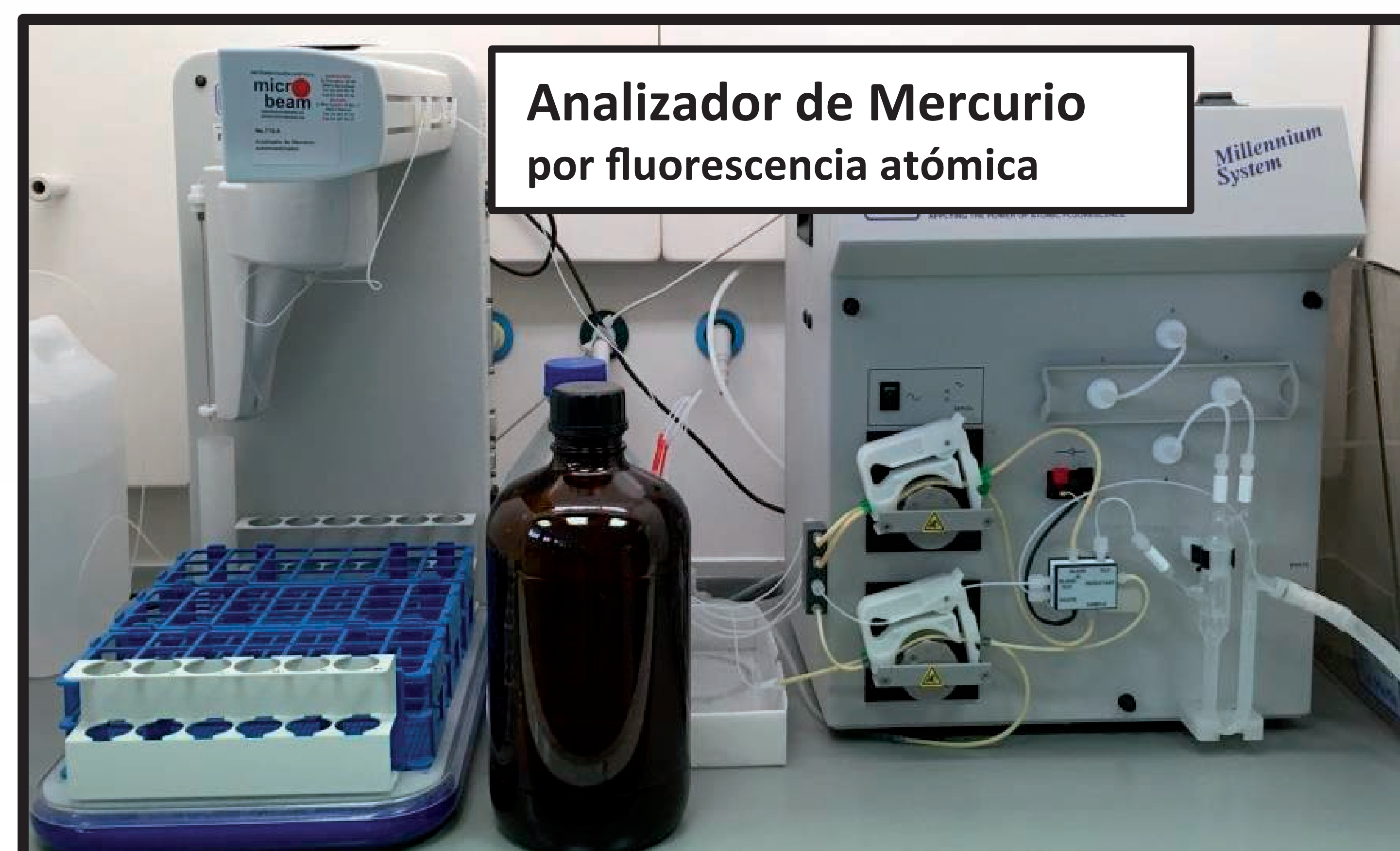
Analizador de Mercurio por fluorescencia atómica

Espectrometría de Emisión con Plasma Acoplado Inductivamente y detector óptico