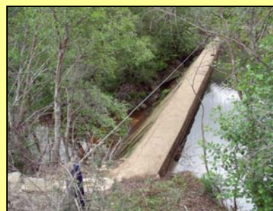
Dcha.: azud en el río Viejas (Cáceres)