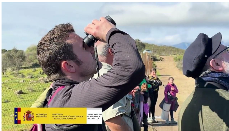
1 - Video de la edición de 2025